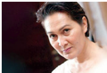
Scénario et réalisation : Yasmin Ahmad