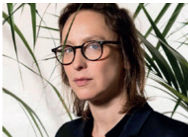
Scénario et réalisation : Céline Sciamma

Dans ses films, mais particulièrement dans celui-ci, Céline Sciamma fait preuve de deux qualités rares dans le cinéma dit « social » : la justesse du regard et la finesse de la mise en scène.